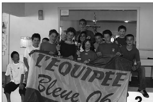
Podium de L'Équipée Bleue avec le spi remporté par l'équipage vainqueur de l'épreuve.

© 0297 30 30 30 – env@jeunesse-sport.gouv.fr