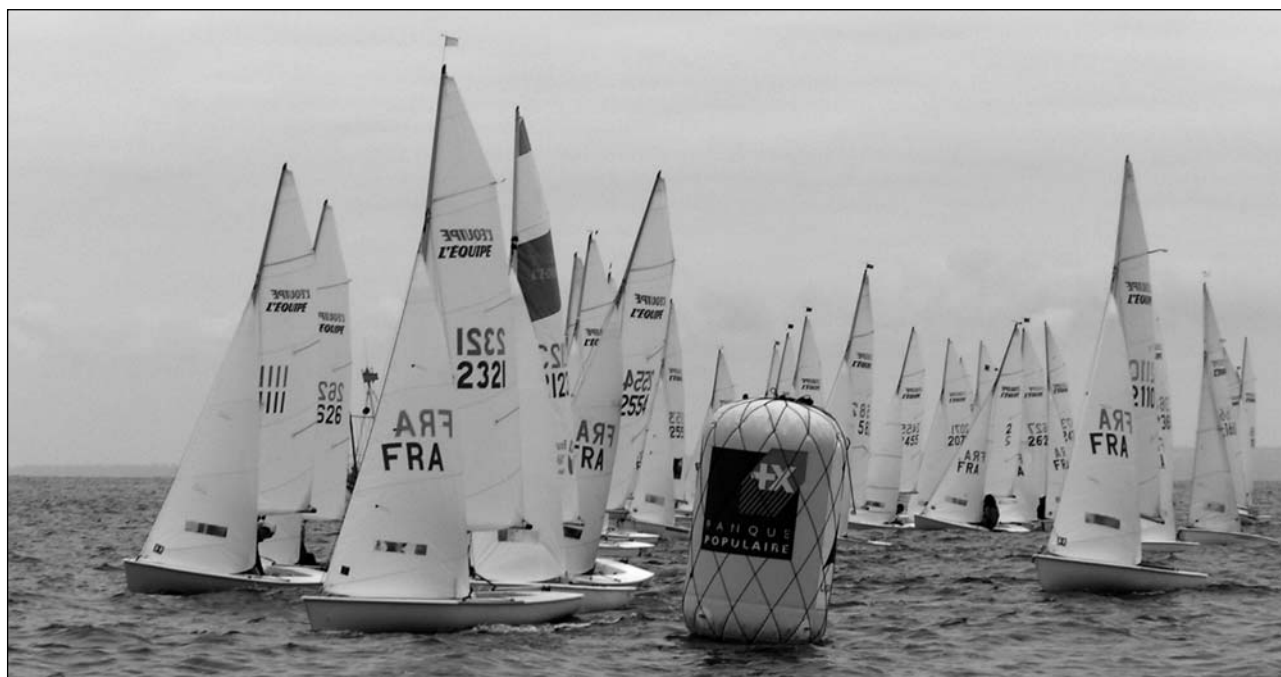
L'Équipée Bleue - Départ dans le petit temps et le courant.